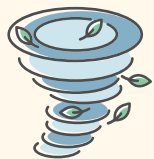
Fenômenos meteorológicos extremos