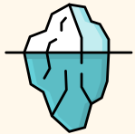
Aumento do nível do mar