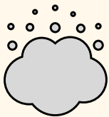
Poluição do ar