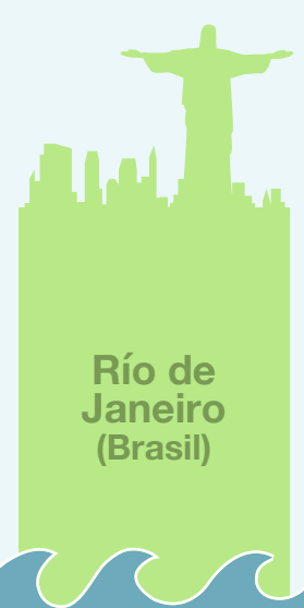
Río de Janeiro (Brasil)

Algunos de los lugares más paradisíacos (Playa Langosta, por ejemplo) de esta turística ciudad mexicana quedarían sepultados.