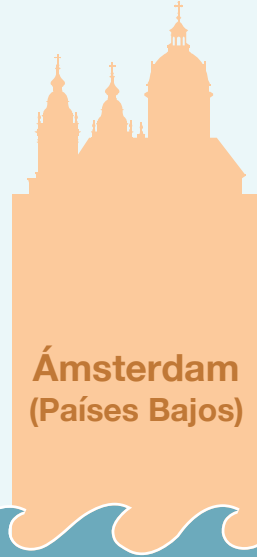
Ámsterdam (Países Bajos)

La subida del nivel del mar haría desaparecer uno de los puertos más importantes de Inglaterra, el Albert Dock .