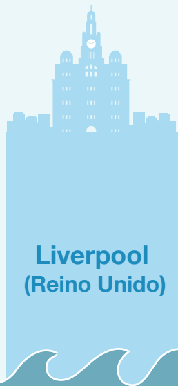
Liverpool (Reino Unido)

La bahía de Cádiz quedaría anegada afectando a zonas como el puerto de Cádiz o a localidades cercanas como San Fernando.