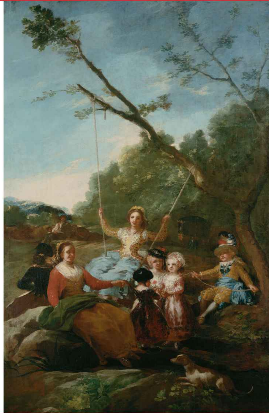
Francisco de Goya y Lucientes, El columpio . Óleo sobre lienzo, 1779. Museo Nacional del Prado, Madrid.