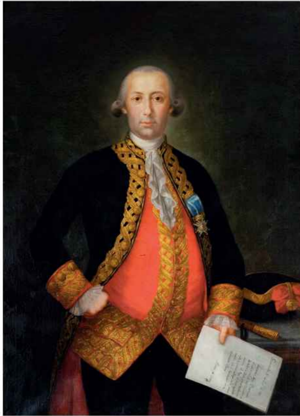
Attributed to Mariano Salvador Maella, Portrait of Lieutenant General Bernardo de Gálvez . Oil on canvas, c. 1784. Private collection.