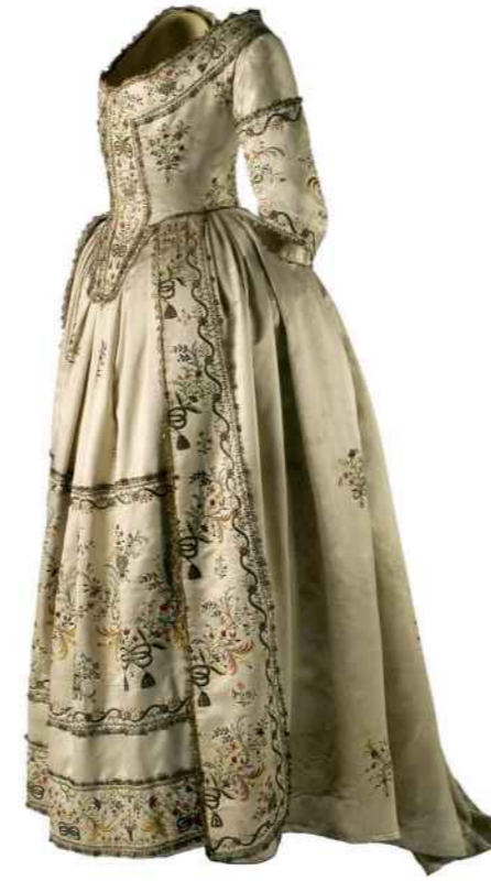
English gown, c. 1780-1790. Ivory-colored satin with decorative embroidery, bobbin-lace trimmings and sequins. Museo del Traje, CIP, Madrid.